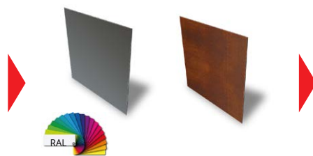
2 FINITIONS POSSIBLES