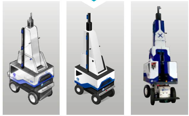
Étude design 3D version finale