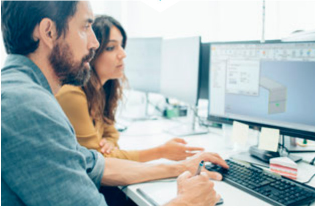
Modélisation / Plan côté / Nomenclature CFAO 3D / Rendu réaliste