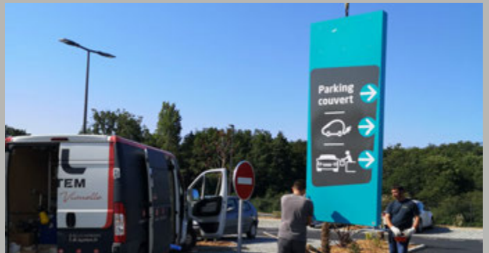
Mise en place d'un totem de 4m sur son massif béton par grutage